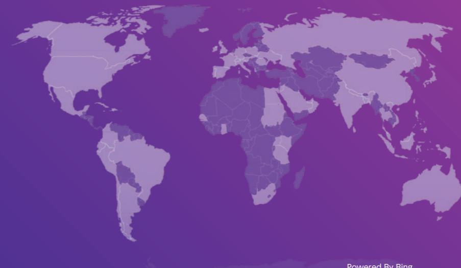
OneTouch®製品の取り扱いがある国 (2021年10月時点)

LifeScanは、全世界に2000人以上の社員を有し、OneTouch®ブランドの製品は、世界中で70以上の国々、2000万人以上の人々に使用されています。