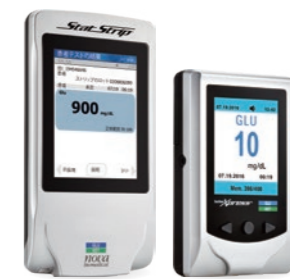
スタートストリップグルコースケトン (左) スタートストリップエクスプレスグルコースケトン (右)