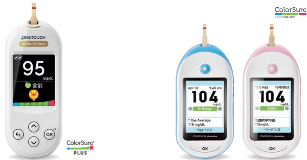
ワンタッチベリオリフレクト™