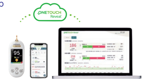
OneTouch Reveal® モバイルアプリ/ウェブアプリ