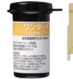
ワンタッチベリオ® センサー