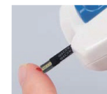
LFSクイックセンサー® (ワンタッチウルトラビュー®)の点着方法