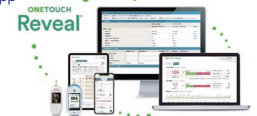
OneTouch Reveal® モバイルアプリ/ウェブアプリ