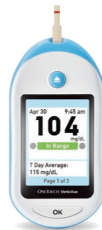
ワンタッチベリオビュー®