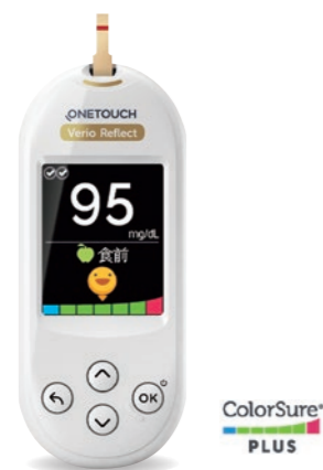
ワンタッチベリオリフレクト™