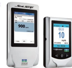
スタートストリップグルコースケトン (左) スタートストリップエクスプレスグルコースケトン (右)